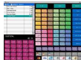
Ecran de vente