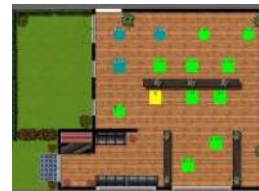
Plan de salle